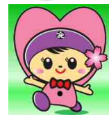
高崎市社協 イメージキャラクター 「たかちゃん」